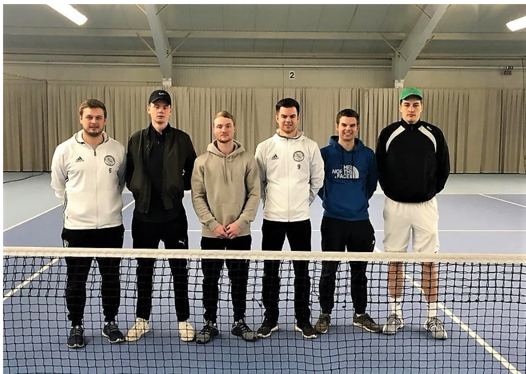
Die erfolgreiche Tennis-Herren-Mannschaft