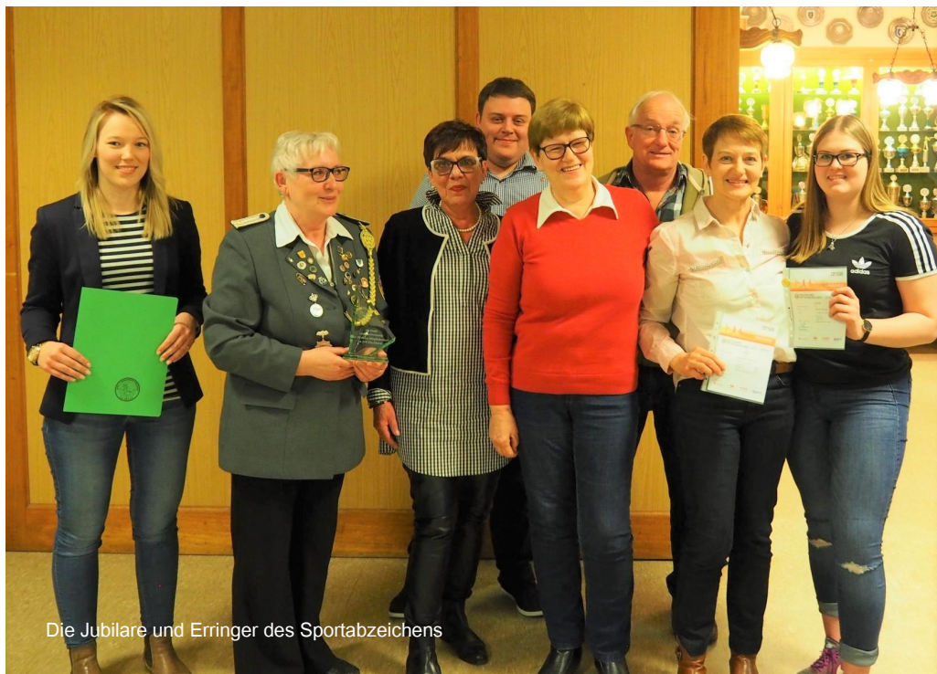
Die Jubilare und Erringer des Sportabzeichens