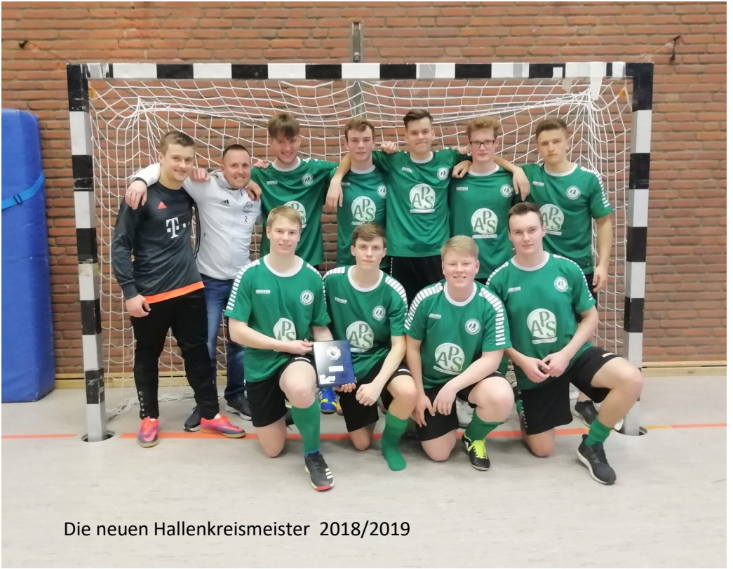
Die neuen Hallenkreismeister 2018/2019