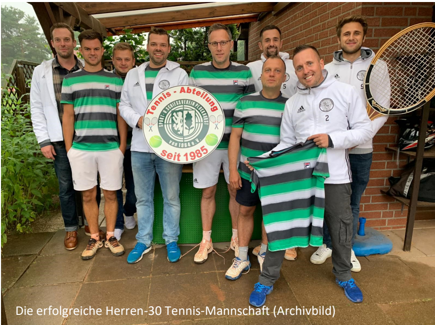
Die erfolgreiche Herren-30 Tennis-Mannschaft (Archivbild)