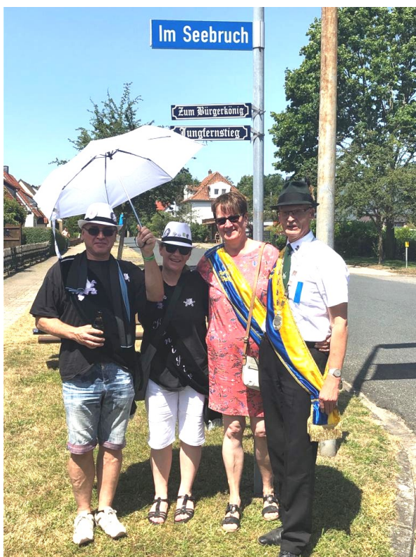
Es grüßen die Könige aus dem Seebruch

sowie die Organisatoren des Schützenfestes