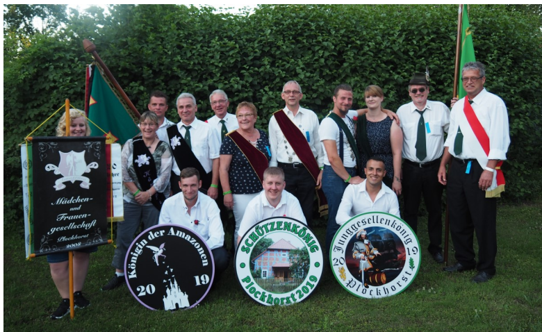
Die Könige von 2019 bis 2021

Zum Schützenfest-Wochenende vom 26. bis 28. Juni werden einige unserer Abteilungsflaggen aufgehängt. Auch dürfen die Häuser bzw. Straßenfronten gern mit Fahnen geschmückt werden. Sei es mit unserer Plockhorster Fahne oder mit Schützenfestflaggen.