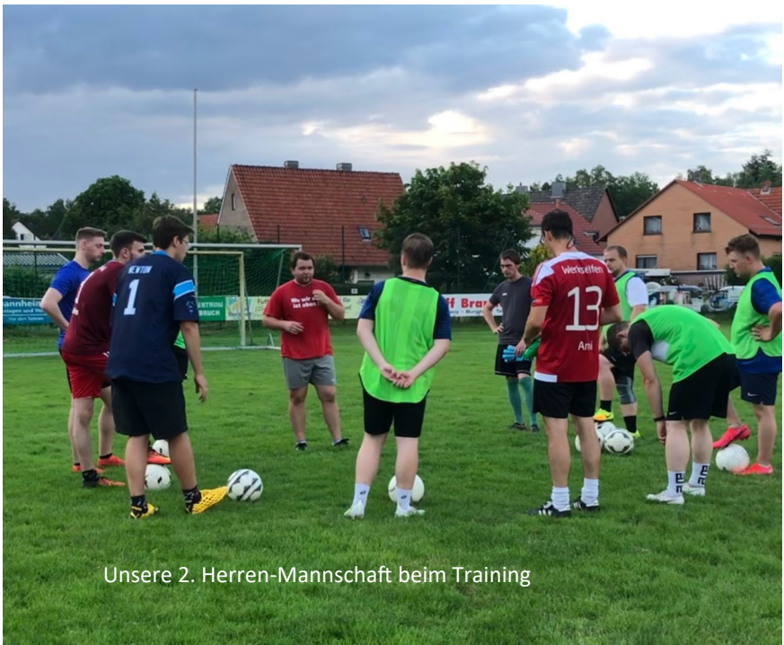
Unsere 2. Herren-Mannschaft beim Training

Endspiele am Sa., 30.07.2021 um 16:30 und 18:00 Uhr