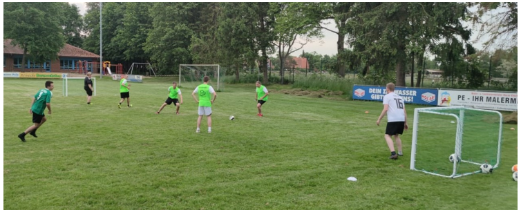
Die 3. Herren beim Training

Bevor das erste Spiel im Stadion am Seebruch stattfand, gab es erst einmal einen Arbeitseinsatz mit Hilfe von Spielern der ersten Herren, um das Gelände aufzufrischen. Neben Unkrautentfernung, Grillecke reinigen, Tore mit neuen Netzen versehen, wurden auch alle Stühle abgekärchert.