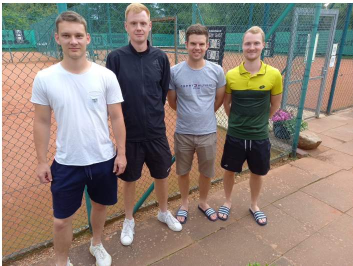
Die 1. Herren-Mannschaft 7

Neben den Punktspielen konnten unsere 1. und die 2. Herren im Pokalwettbewerb des Niedersächsischen Tennisverbandes überzeugen. Die 1. Mannschaft schaltete in diesem Wettbewerb zahlreiche, namhafte Gegner und sogar den letztjährigen Pokalsieger Wolfsburg aus, unterlagen dann aber ganz knapp im Viertelfinale der starken Mannschaft aus Göttingen.