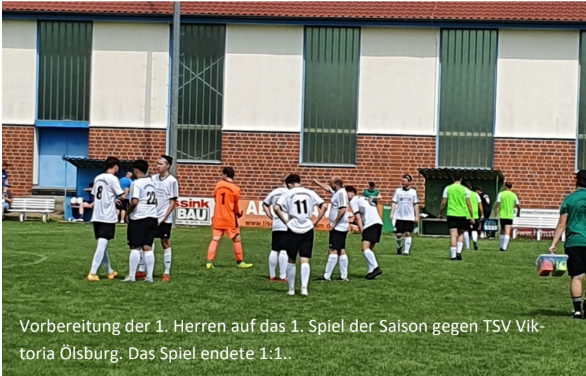
Vorbereitung der 1. Herren auf das 1. Spiel der Saison gegen TSV Viktoria Ölsburg. Das Spiel endete 1:1..

Am 20.10. waren alle Trainer, Betreuer und Mitglieder des Abteilungsvorstandes erneut vom Förderverein Fußball zum traditionellen Schnitzeessen bei Pröve eingeladen. Wieder einmal eine gelungene Veranstaltung.