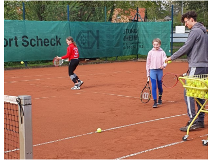
Die Kinder und Jugendlichen sind mit Spaß beim Training dabei.

Leider reichte es noch nicht um eine Tennis-Jugendmannschaft zu melden, aber vielleicht im Sommer 2022, sofern es möglich ist.