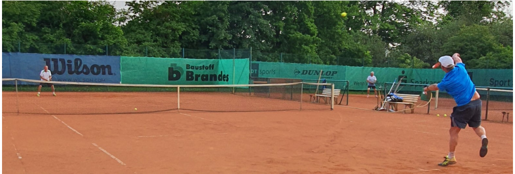
Unsere Herren 50 in voller Aktion