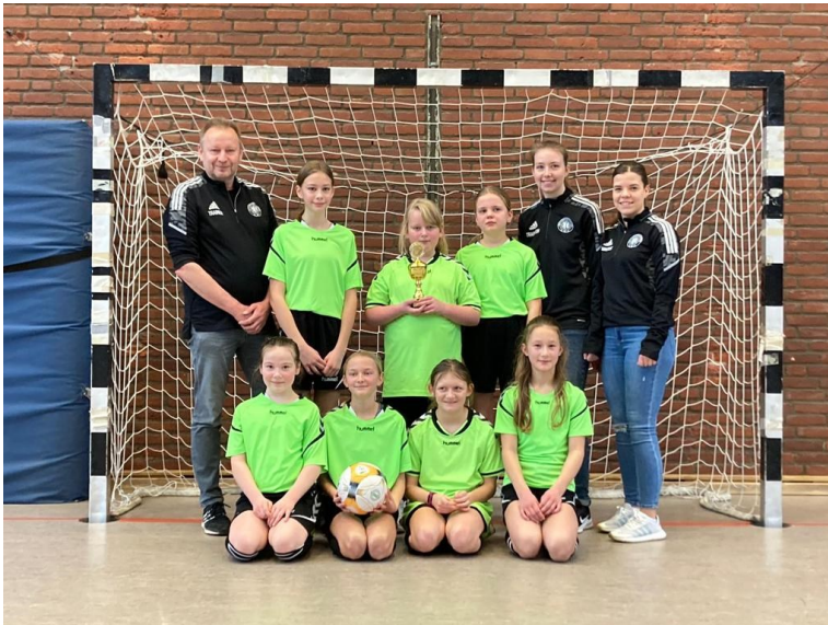
Die E-Juniorinnen präsentieren stolz ihren Siegerpokal.

Gespielt wurde im Modus „Jeder-gegen-Jeden“ mit insgesamt fünf Mannschaften. Dabei kamen vier Mannschaften aus dem Kreis Peine und mit dem VfL Eintracht Hannover kam eine bis dato für uns unbekannte Mannschaft aus der Nachbarschaft. Wir starteten gut ins erste Spiel und konnten die ersten drei Punkte durch einen 1:0-Sieg gegen die JSG Eixe / Abensen einfahren. Im zweiten Spiel gegen die Mädels von Arminia Vechelde erzielten wir in zehn Minuten zwei Tore und gewannen auch das Spiel ohne Gegentor.