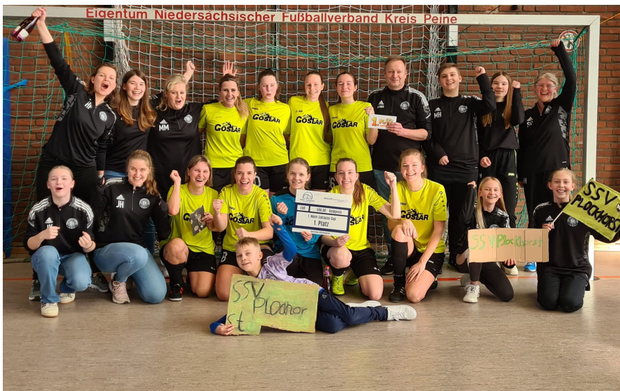
Die siegreiche Damenfußballmannschaft