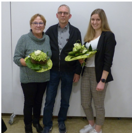
Die ausscheidenden Vorstandsmitglieder