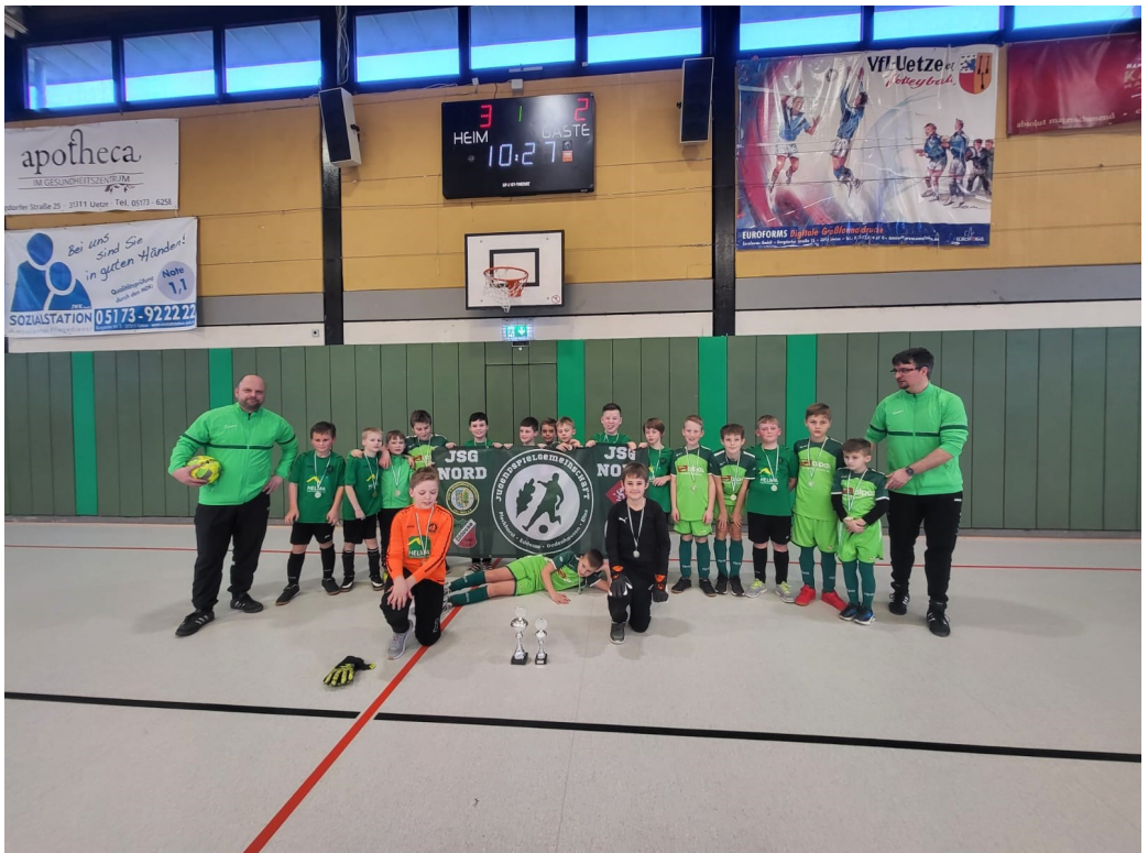
Die E-Jugend der JSG Nord